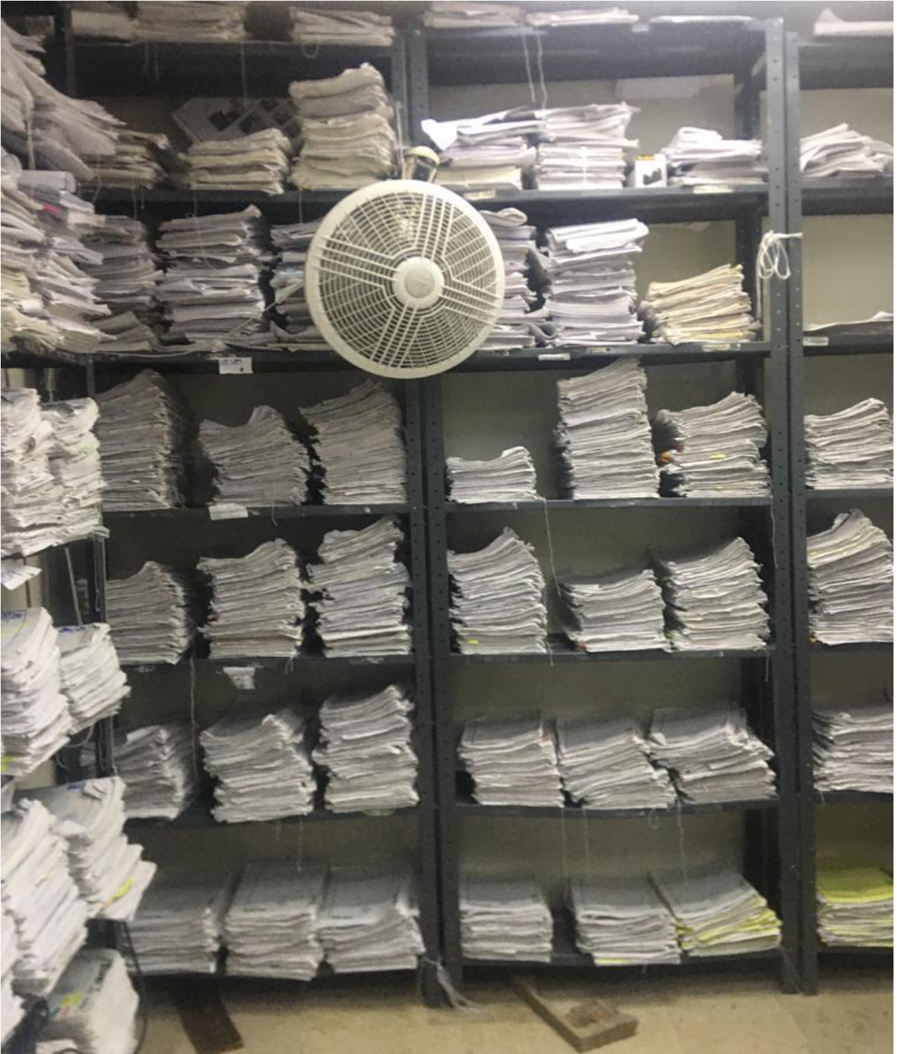
Anaqueles 6 y 7, resguardando expedientes de los años 2020 y 2021.