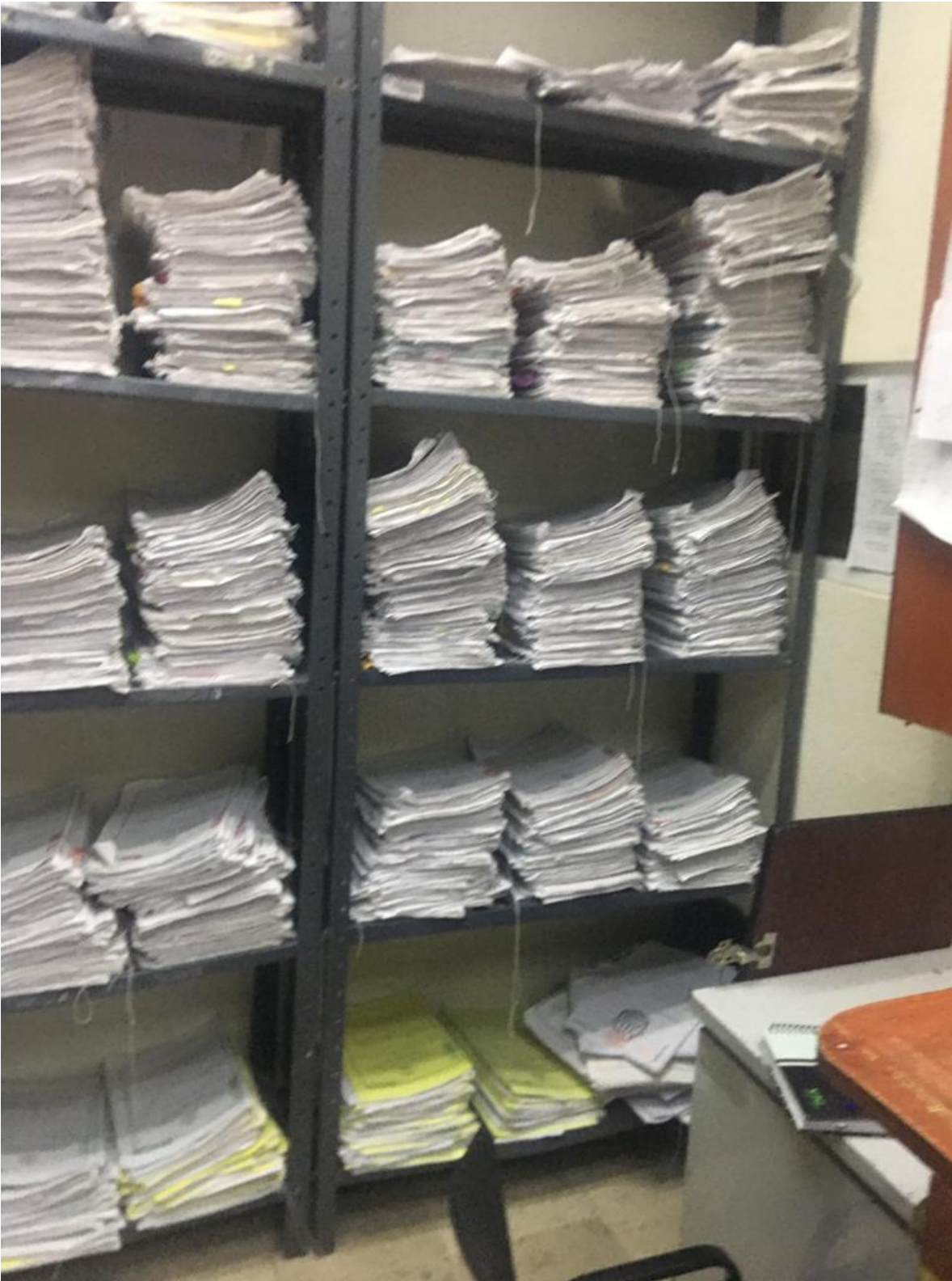
Anaquelel número 8 resguardando expedientes 2022, exhortos 2021 y expedientillos y promociones irregulares 2021.